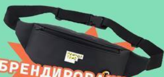
БРЕНДИРОВАННАЯ СУМКА НА ПОЯС