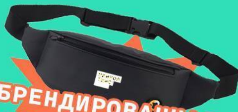
БРЕНДИРОВАННАЯ СУМКА НА ПОЯС